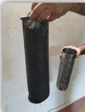
Sostituzione calza filtrante

Nei controlli successivi del 7 e 30 Dicembre 2016 e del 26 Gennaio 2017, sono state eseguite le verifiche di rito (concentrazione prodotti – portata di ricircolo – pulizia filtri).